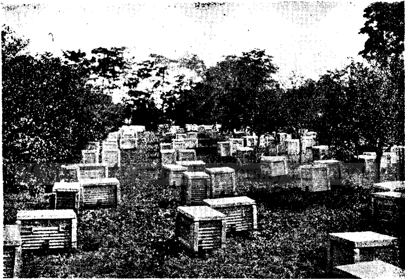
Vándorméheszet Bocsnádi kaptárokban.

sel nyugodtan kivárja az akár hetekig tartó zord időjárás megszűntét és a szép napok beköszöntésével rajként tódul kifelé a megmentett értékes dolgozó méhsereg . Ugyanakkor a többi kaptárból csak nagyon gyéren repülnek, mert a rossz időjárás alatt a családtagok legyengülnek. A zord időben lezárt köpenyes család akácról akkor is adott 30 kg felesleget, amikor más rendszerű kaptárakban lévő, a szeszélyes rossz időben is kirepülő családok csak 5 kg-ot adhattak. E módszer korszakot jelenthet méhészetünkben az akác kihasználását illetően. (A tavaszi szeszélyes időjárásból sajnos Erdélynek is bőven kijut! Szerk.)