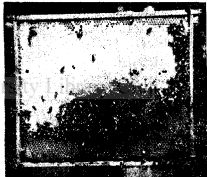
A nagyfelületű NB-lépeken jól telel a család.

Ugyancsak mérlegelési adataink bizonyítják, hogy a szabadban álló köpenyes kaptárakban semmivel kevesebbet fogyasztottak többet, mint a zárt helyiségekben. Tehát tapasztalataink szerint felesleges ve-