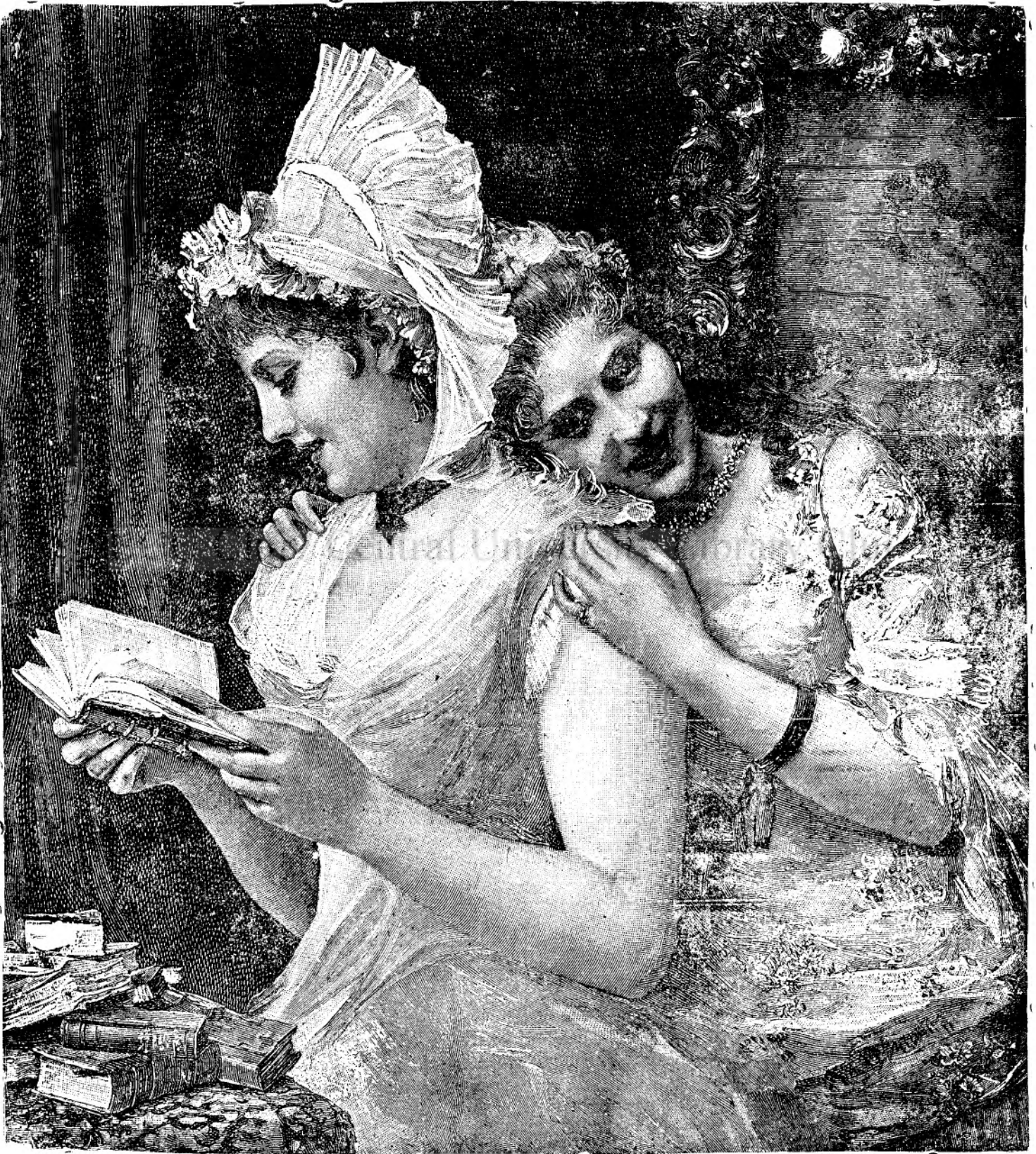
O carte interesantă.

cum ni se părea atât de dulce: Copii, la culcare! După ce se stingea lampa, me întorceam cu fața către Aurel și-l priviam în tăcere, prin întune-