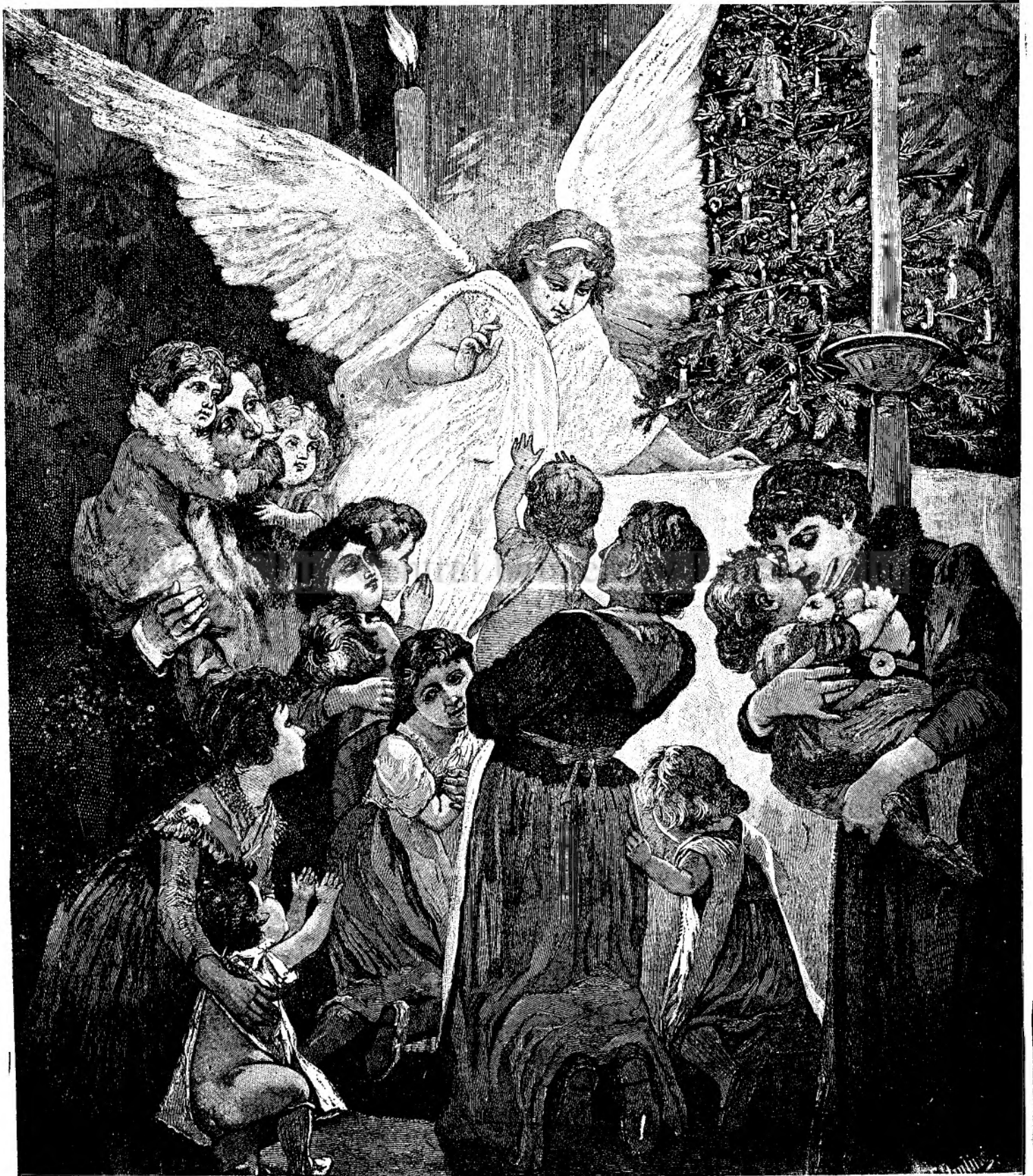
Ingerul s'a pogorit.