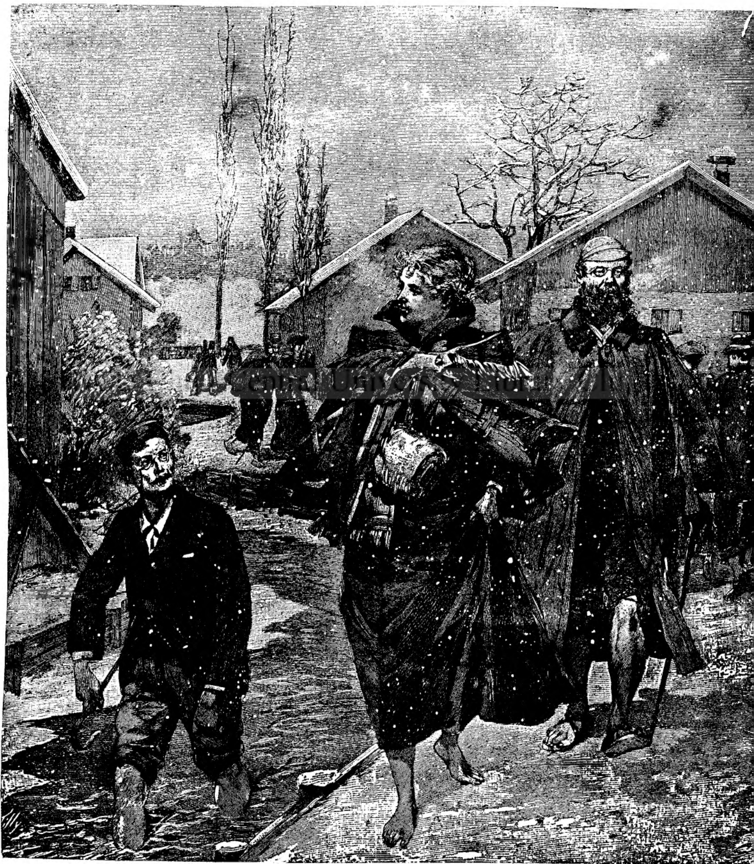
Cura Kneip iarna.