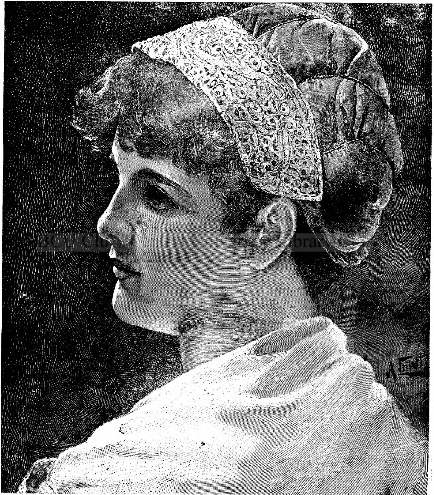
Z o i ț a.