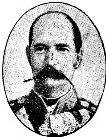
George I. regele Greciei.

Cinci laturi ale cubului erau cioplite netede și potrivite exact în gaura patrungiulară largită ase-