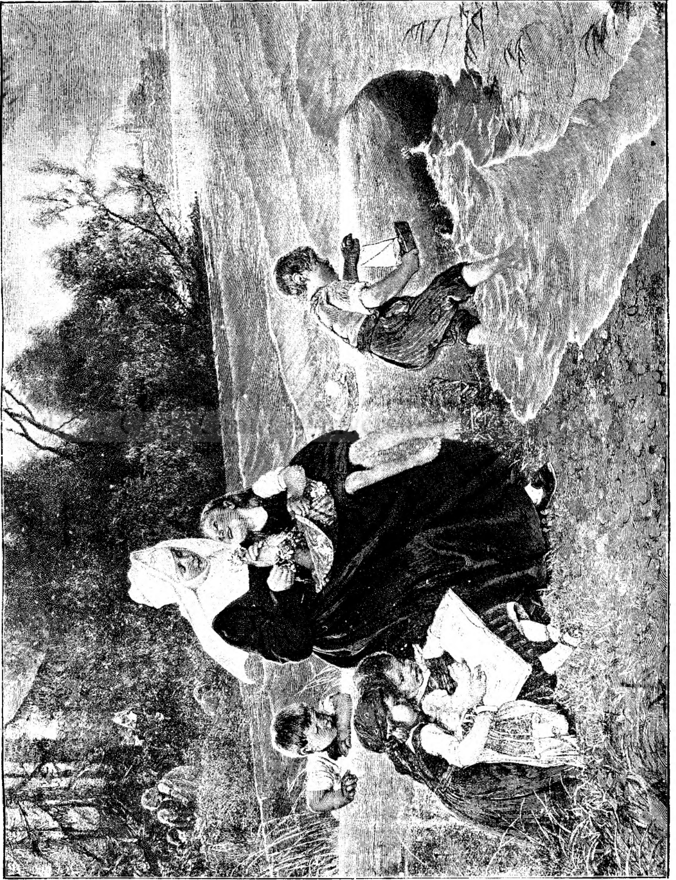
Asil pentru copii pe malul mării.