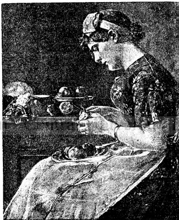
Se gată prânzul.