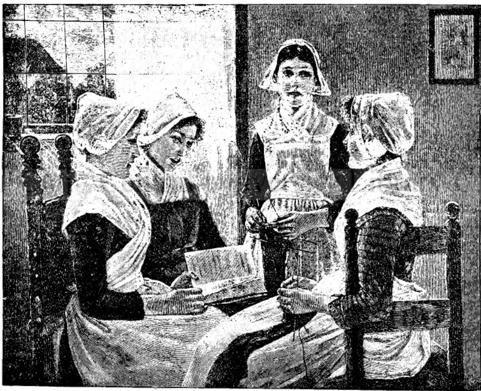
Eleve în claustru.

Nainte cu Christos și cu vergina Marie, Voinicii care luptă de ghiulele nu vor să știe Ca grindina gloanțele cu miile să vie, A noastră-i Macedonia, căci e fiica Romei, se știe.