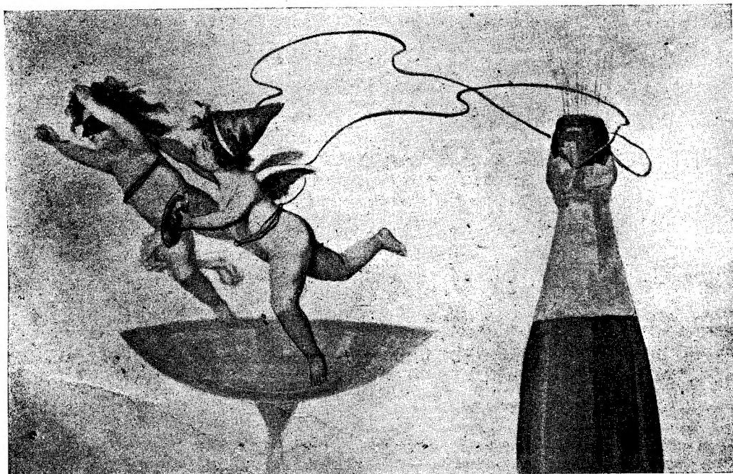
Carneval se duce la bal.

„Zobar, Loico Zobar era un țigan tinăr. Îl cunoașce toată Ungaria, Slavonia și tot ce e împregiurul mării il șcicia pe viteazul tinăr. Nu era sat unde să nu se fi făcut jurământ ca să-l omoare, dar el