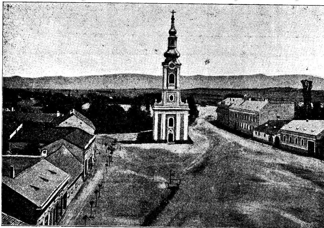
Piața Beinșului cu biserica gr. cat. română și gimnasiul.