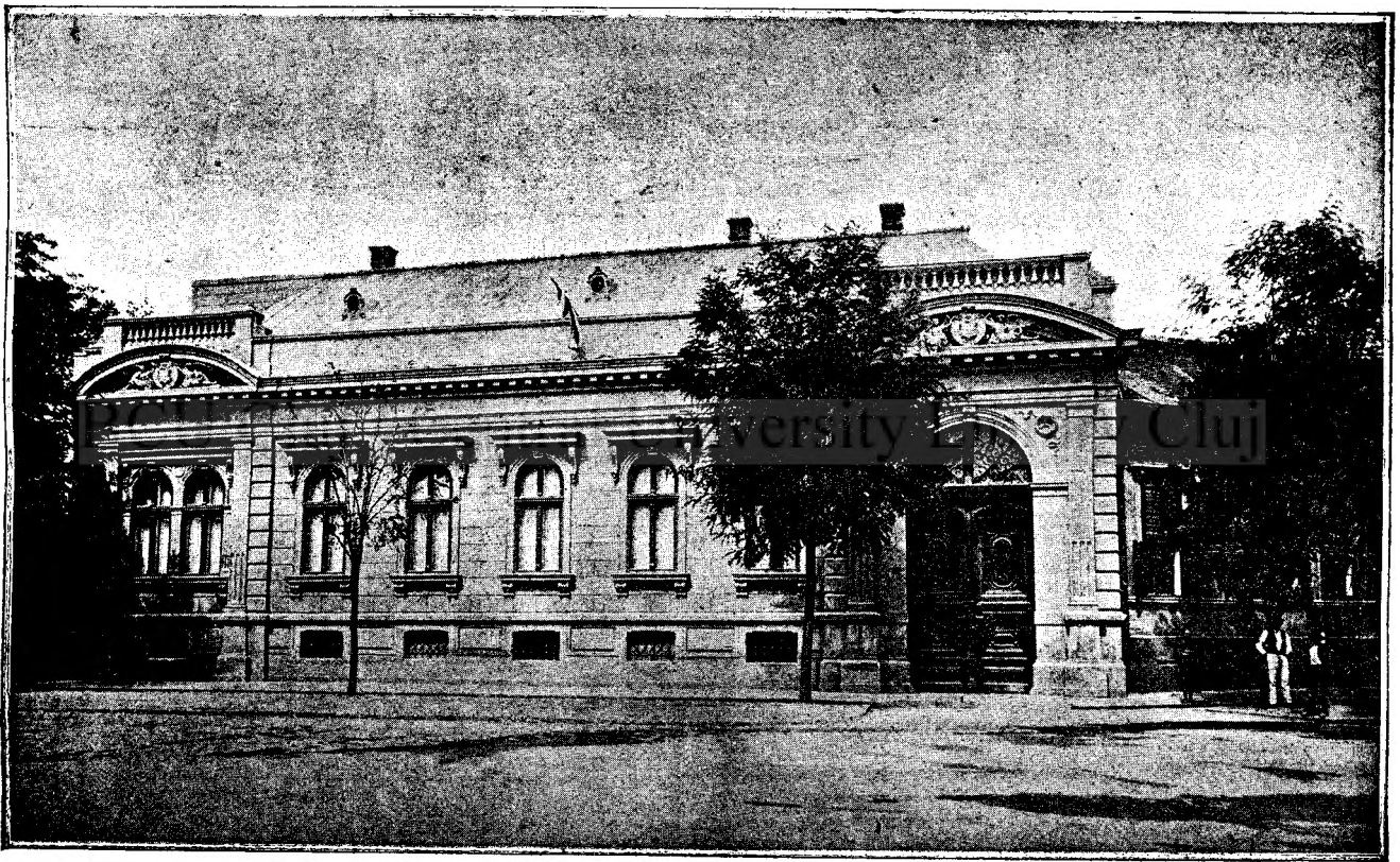
Reședința episcopescă gr. or. română din Arad.

La trupina unui copaciū bătrân dormiau cinci