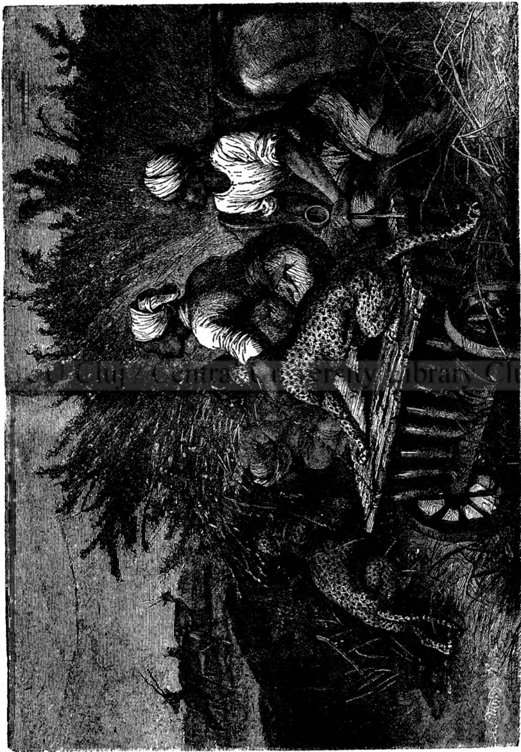
VENÂTÔRE DE ANTILOPE.