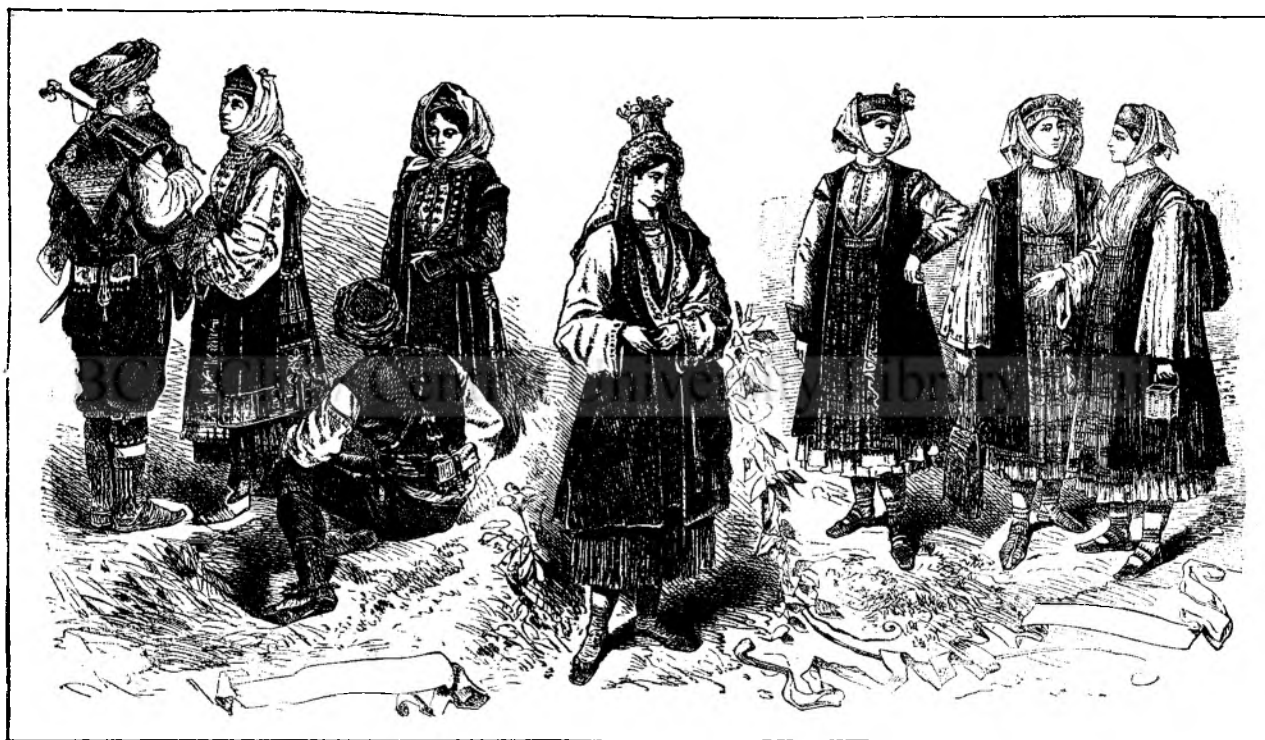
Porturi poporale din Dalmația.

»Frumosu-i cap zăcea pe perina roșită de sánge, pèrul de asemenea îi érá plin și fața vénéțá. Ochii