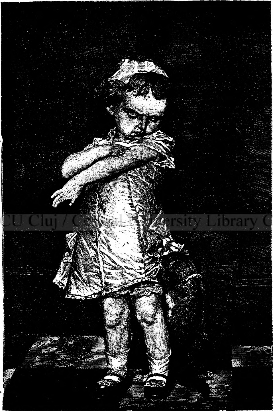
M'A ZDĂRIAT PISICA.