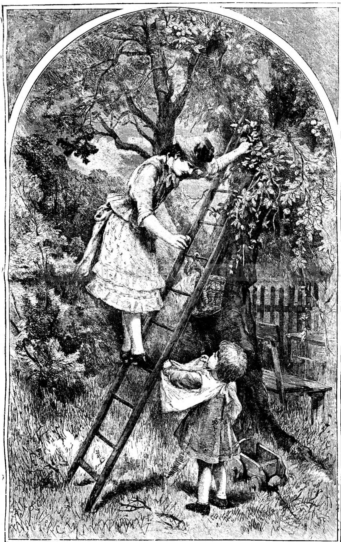
Т ó м н а