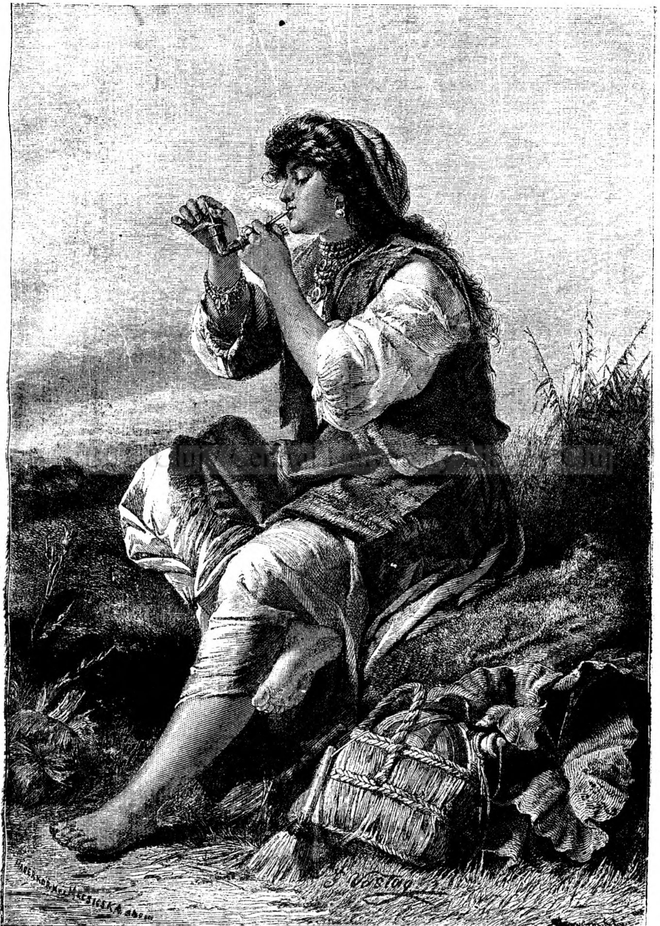
T i g a n c a .