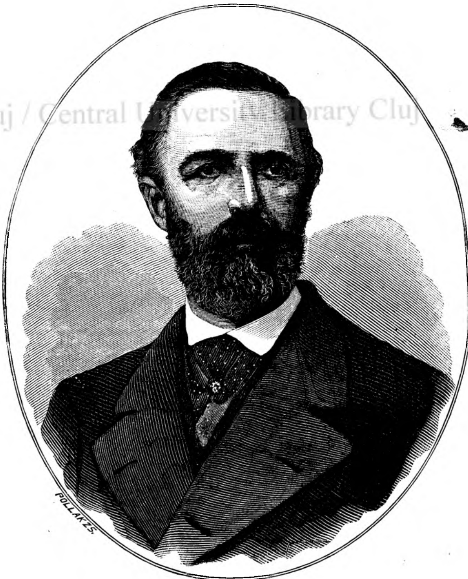
Oscar II, regele Suediei și Norvegiei.

pe tron, n'a mai publicat nimica. Cel puțin nu sub numele său. Căci, precum a dis, grigile serioase ale domnitorului numai puțin timp lasă pentru fantasii poetice.