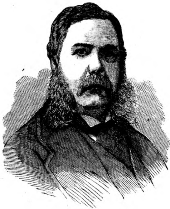
Chester A. Arthur.