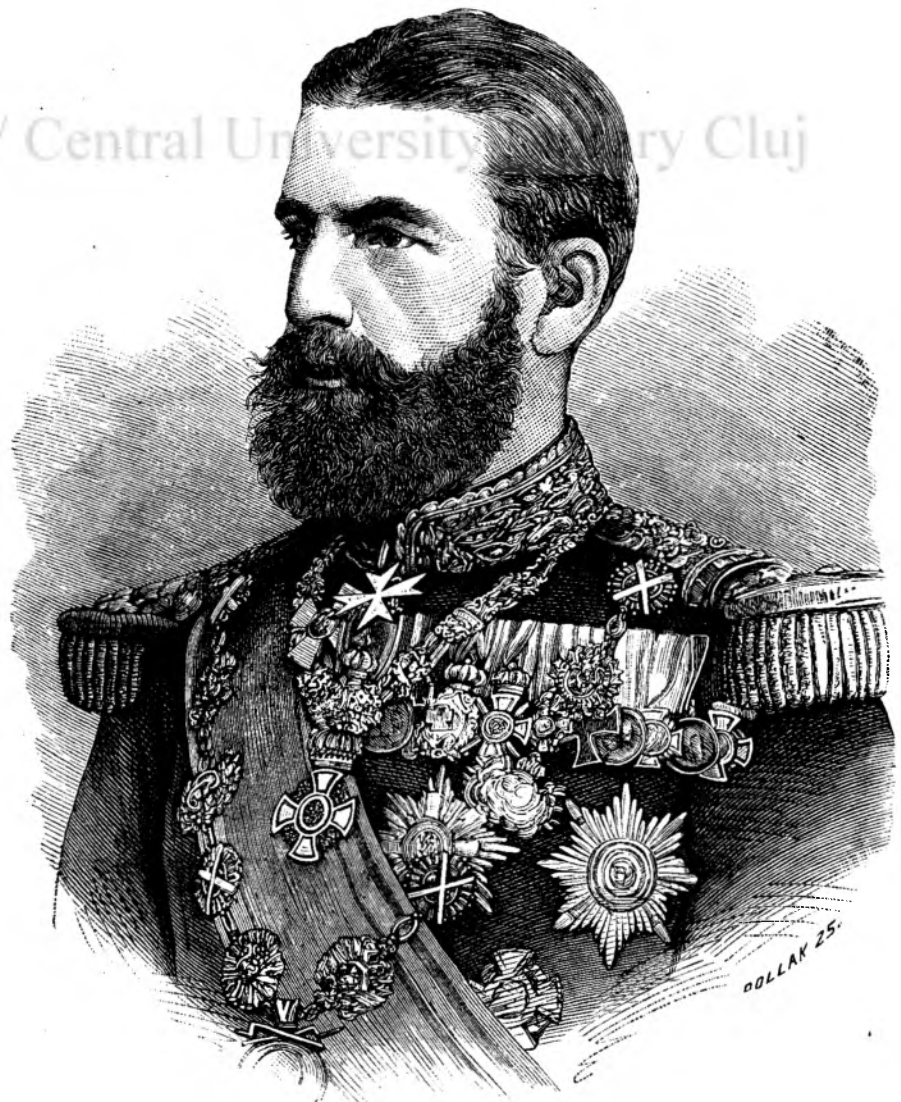
Carol I regele României.

gloria romãnã, veți ceti acolo despre eroismul lui Mircea, Ștefan cel Mare și Mihaiu Vitezul: însé ori cât de mari și admirabile aũ fost faptele lor, acele totuși nu puturã produce pentru țera lor un rezultat atãt de