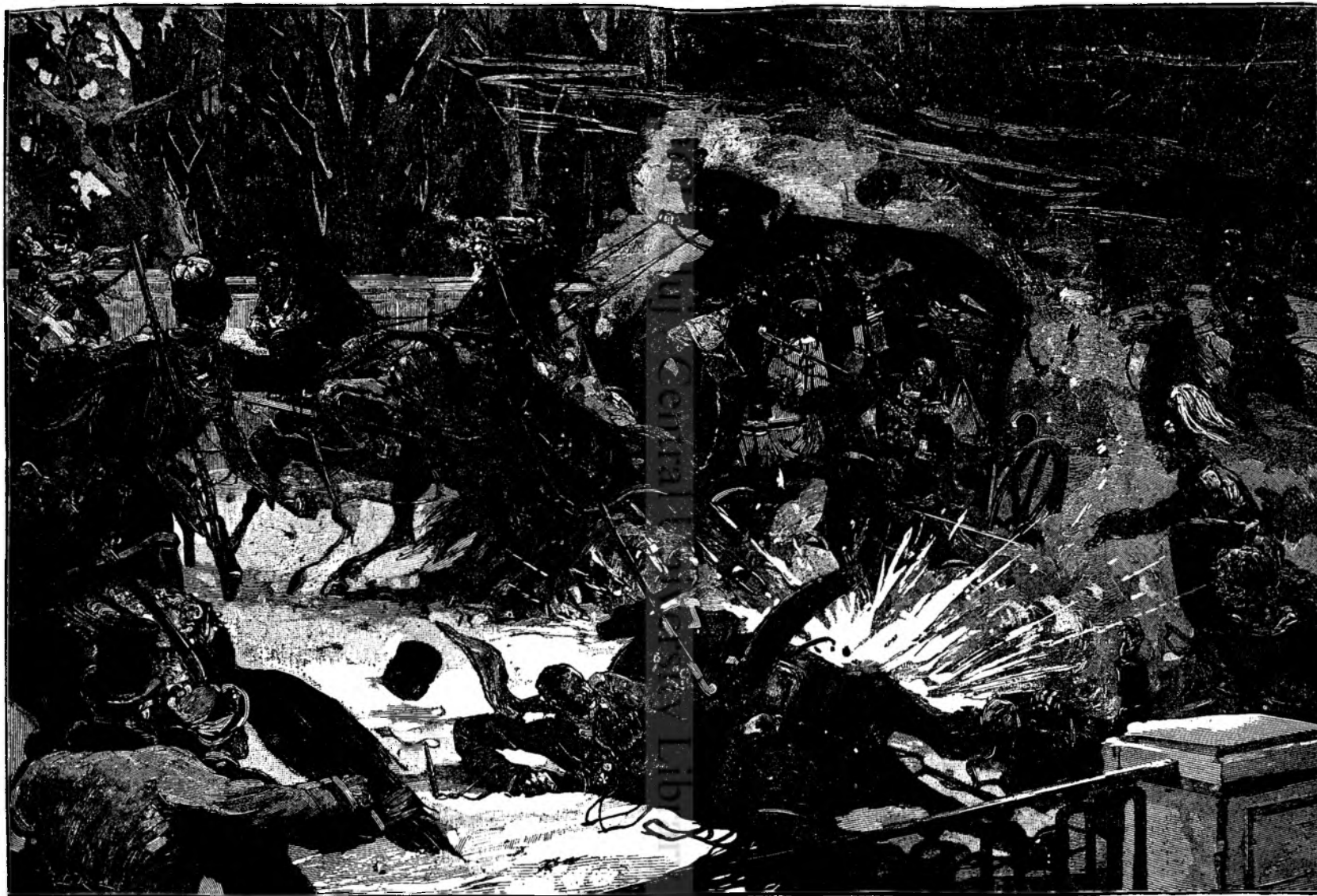
Atentatul dela Petersburg Esplosiunea bombei a două.