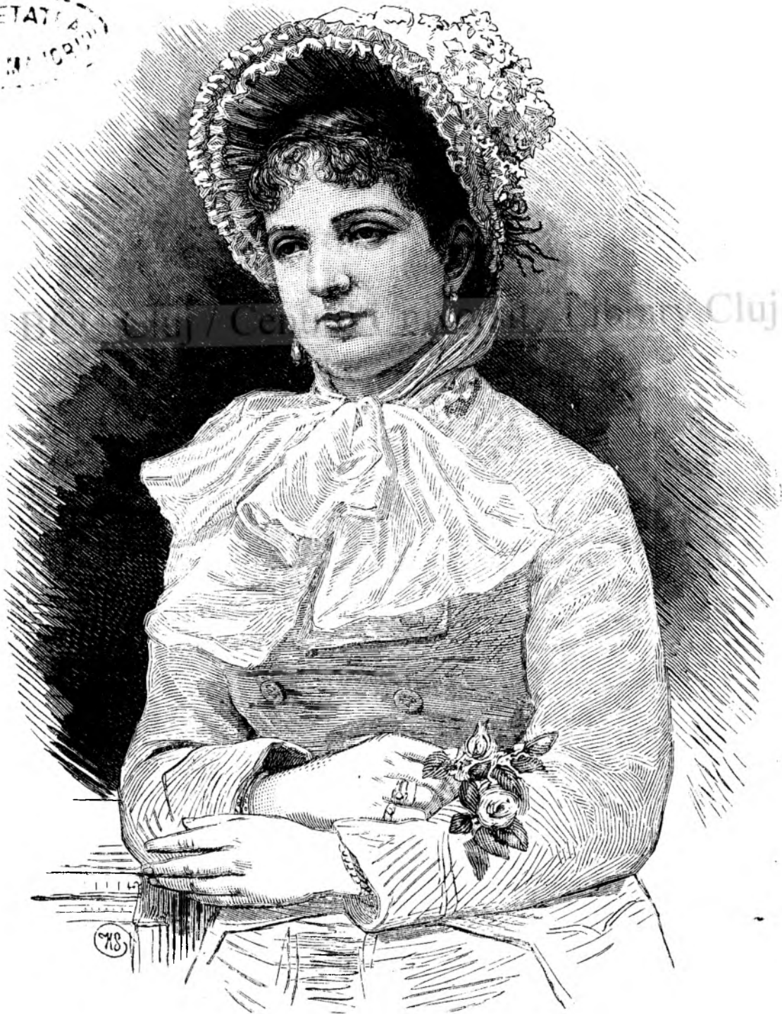
Margaret'a regin'a Italiei.