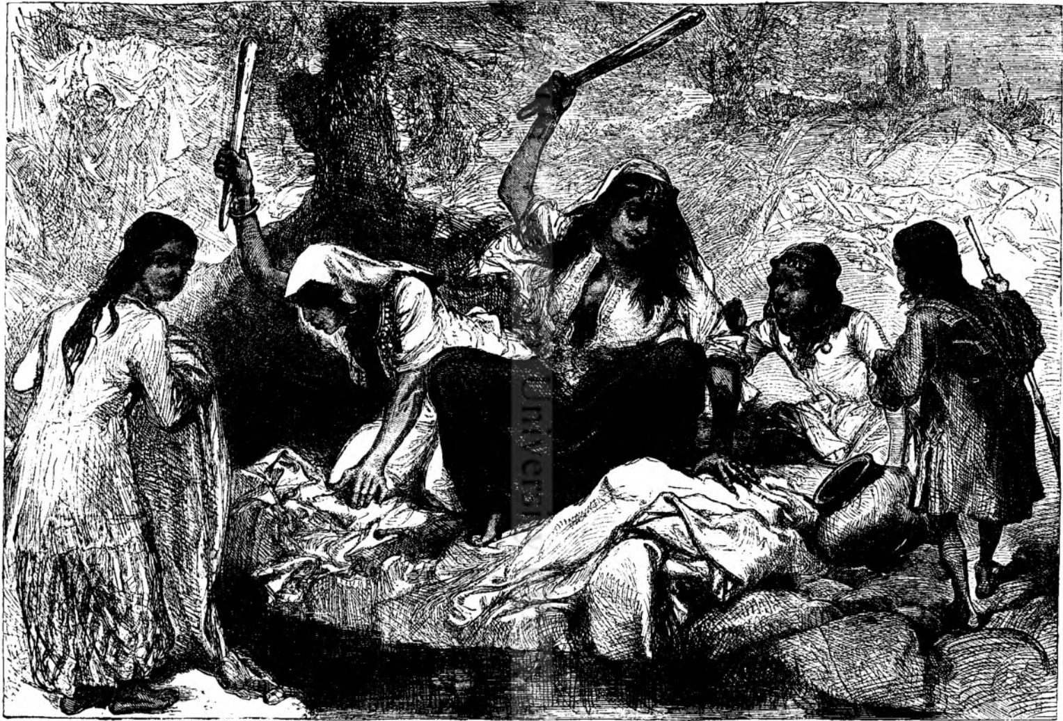
Spelatorese in Afganistan.