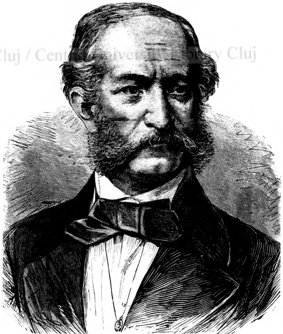
Br. Henricu Haymerle.

numai mai târdiu a obtinutu rangul de baronu. Întrându pe carier'a diplomatica, a trecut pe tóte treptele aceleia, pâna ce în urma fu numitu ambasadoru la Roma, de unde apoi se urcá în postul ce-l ocupa acuma.