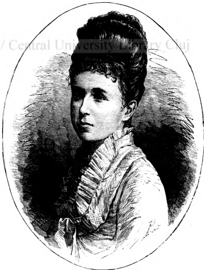
Regin'a Cristina a Spaniei.