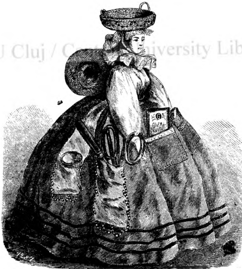
Vivandier'a ca tînetórea uneltelor de cosutu.

Vivandier'a are pe spate unu ghiemu de atia in form'a unui vasu, care prin o prima colorita e stensu de papusia. In pusunarele rochiei inainte sunt foitiele cu ace, in capetele decorate cu margele ale incingatórei inea sunt pusunare pentru fórfece, degetarie, andrea si. a.