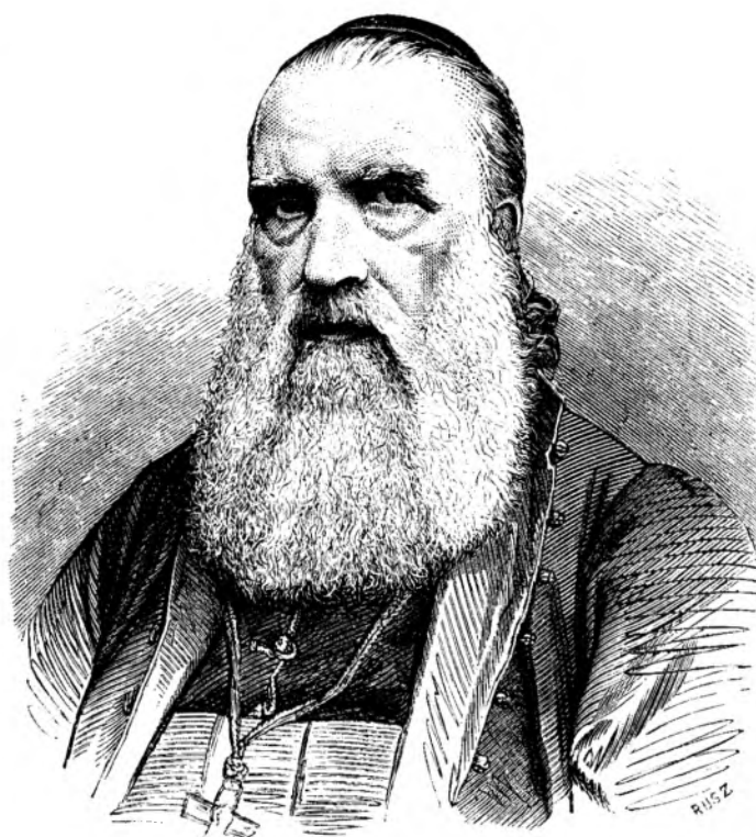
Andreiu Baronu de Siaguna.

Biseric'a gr. resaríténa si intrég'a natiune romana a incinsu dejá fruntea acestei autoritáti stralucite cu cunun'a recunoscintiei, pentru ostenele-i ne bosite si faptele mari, ce le-a facutu spre binele, marirea si bunastarea bisericeii si ale natiunei. — Fruptele ostenelelor Sale sunt dejá scrise pe paginile istoriei cu litere nesterse, sunt intiparite pentru totudéuna in animile romanilor din Transilvania Ungaria si Banatu. — Decandu Escelenti'a Sa prin stralucitulu seu talentu a ajunsu la acea trépta, de unde mai evidente pote lucrá si aredicá vócea pentru