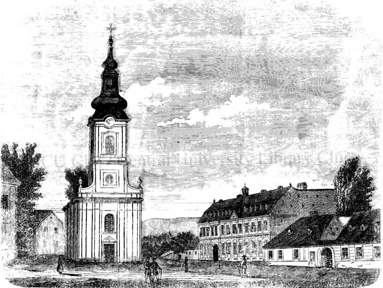
Piat'a si gimnasiulu gr. c. romanu de Beiusiu. (Vedi pag. 208.)

Mustafa urmă betranului si intră in paradulu stralucitu unde lu asceptá corulu dinelor care de care mai frumósa si mai placutu suridietóre, dar' tóte frumsetiele acestora nu ajungea cu tipulu dragalasiu, cu fati'a incantátóre