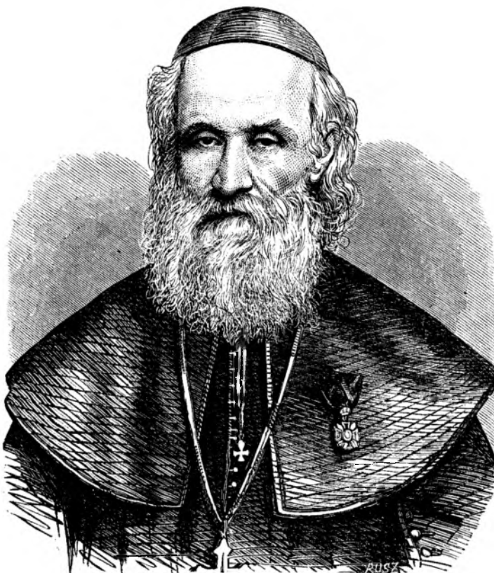
Alesandru Sterca Siulutiu.

Si totusi ce minune! Dintre toti Romanii nicairi nu s'a desvoltatu mai de graba spiritulu