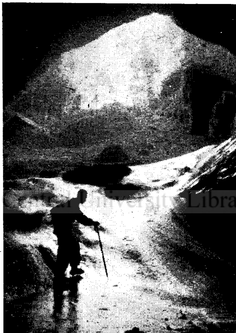
A Szilicei jegesbarlang bejárata a zuhatag pereméről nézve.

A »nyári jég« keletkezése kérdését Bertalan csak röviden érinti. Megjegyeznén, hogy az adott viszonyok között a nyári jégbőségnek, illetőleg a téli jégszűkének nincs semmi különösebb rejtélyes oka. Voltaképp a szilicei jeges barlang csakugyan természetes jégverem; az északnak