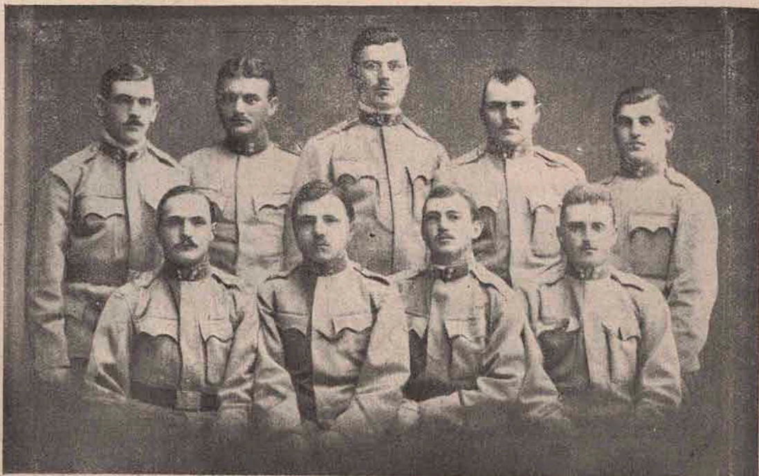
Un grup de voluntari români din Cluj, plecați acum de curând pe câmpul de luptă.

sau chiar toamna lui 1915, cum ar fi trebuit să fie... Chiar dacă s'ar reuși însă, — punerea pe picior de luptă o să fie escadra aceasta în loc cu cel puțin diferența aceasta de timp.