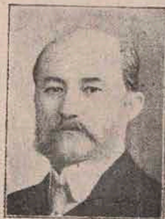
Em. Porumbaru, Ministru de Externe.