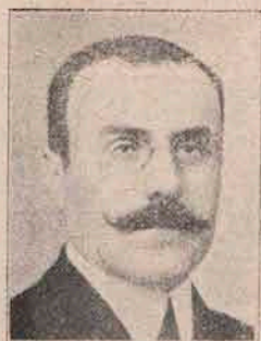
C. Angelescu, Ministru Lucrărilor Publice.