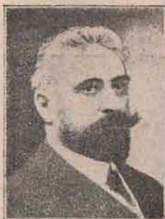
I. I. Brătianu, Prim-ministru și Ministru de Războiu