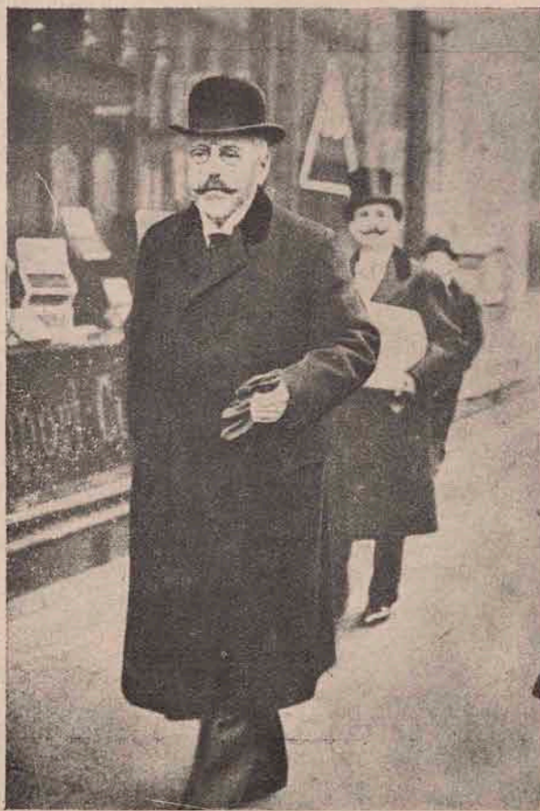
Baronul Stefan Burian : noul ministru de externe al Austroungariei.