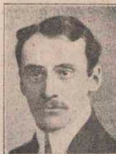
I. G. Duca, Ministru Instrucției și al Cultelor.