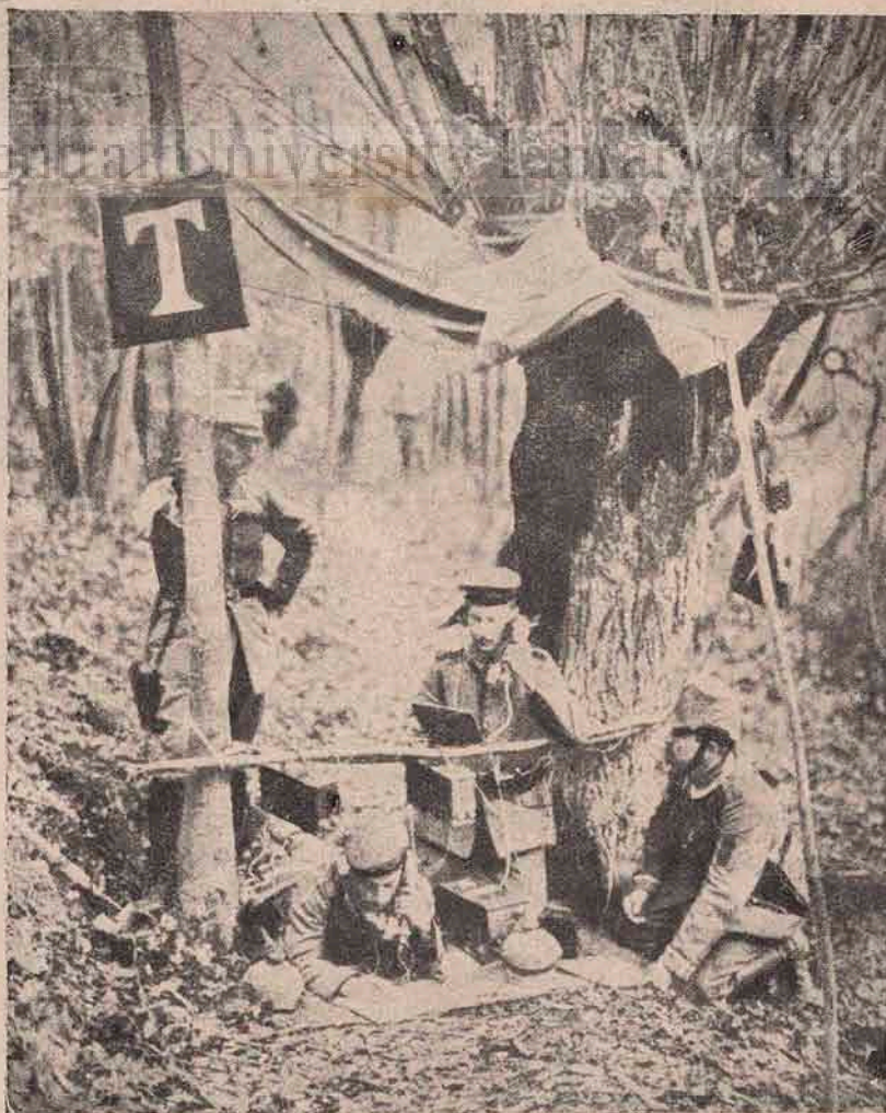
Războiul german. O stațiune de telefon a trupelor germane pe câmpul de luptă de lângă Soissons.

Dacă adăugați acum bastimentele construite în Anglia, pentru comptul marinelor streine, și pe cari Amiralitatea a pus mâna imediat după izbucnirea conflictului, veți împărtași desigur încrederea pe care o exprimă pe la mijlocul lunii Noemvrie la Guildhall (primăria din Londra) primul lorg d. Winston Churchill.