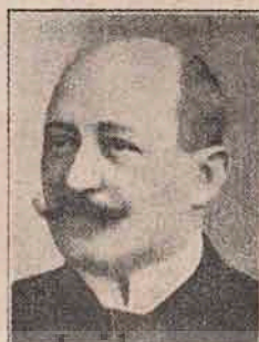
Al. Radoviciu, Ministru Industr. și Comerțului.