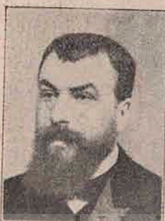
V. Morțun, Ministru de Interne.