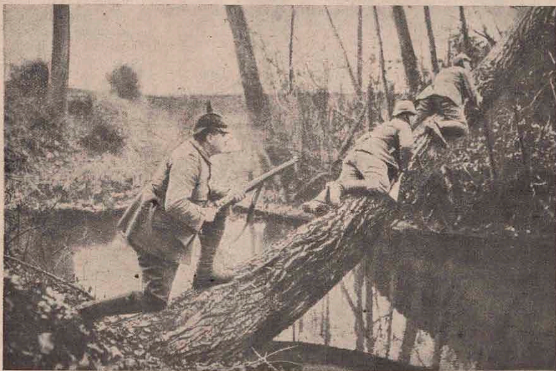
Lupta dela Soissons. Patrulă germană spionând poziția inamicului în lupta dela Soissons.