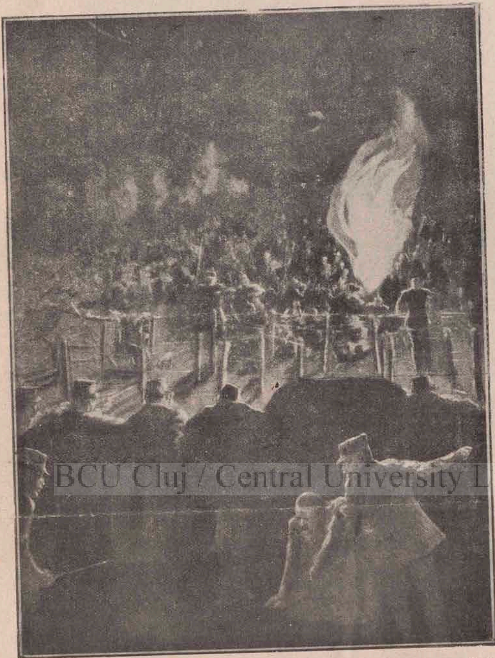
Luptele din Nord-Vestul Franței: Un detașament de infanterie franceză (în planul întâiu) se nizuște să oprească cu focuri de salvă înaintarea unui detașament german care vine să ia cu asalt obstacolele garnisite cu garduri de sârmă cu țepi, cari apără pozițiunea disputată.

perfecționat. Dar aici personagiul se schimbă. Lângă un pod, în mijlocul apei, stă un pescar și prinde pește.