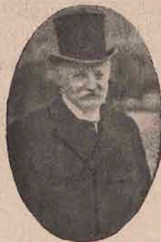
Bülow, noul ambasador al Germaniei la Roma.

O, am trecut și noi, har Domnului, peste vremurile când nu ne vedeam săturați nervii de otrava știrilor de senzație. Azi trecem pe lângă știrile de războiu și nu le cetim, vorbele goale nu ne mai excită fantazia. Fapte, fapte împlinite am dori să vedem odată!..