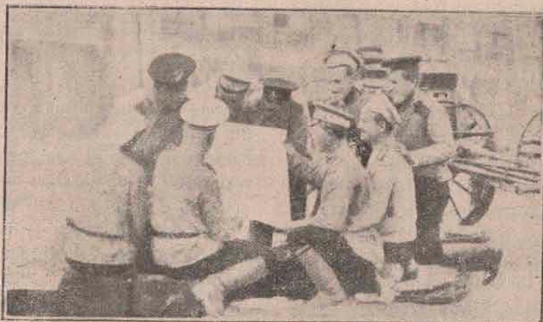
De pe câmpul de luptă din Galiția: După terminarea unei lupte sângeroase, soldații ruși se află adunați în fața primăriei din satul unde li s-a distribuit scrisorile și gazetele de acasă.

Prin această nu se decise încă definitiva soartă a Varșoviei. A treia