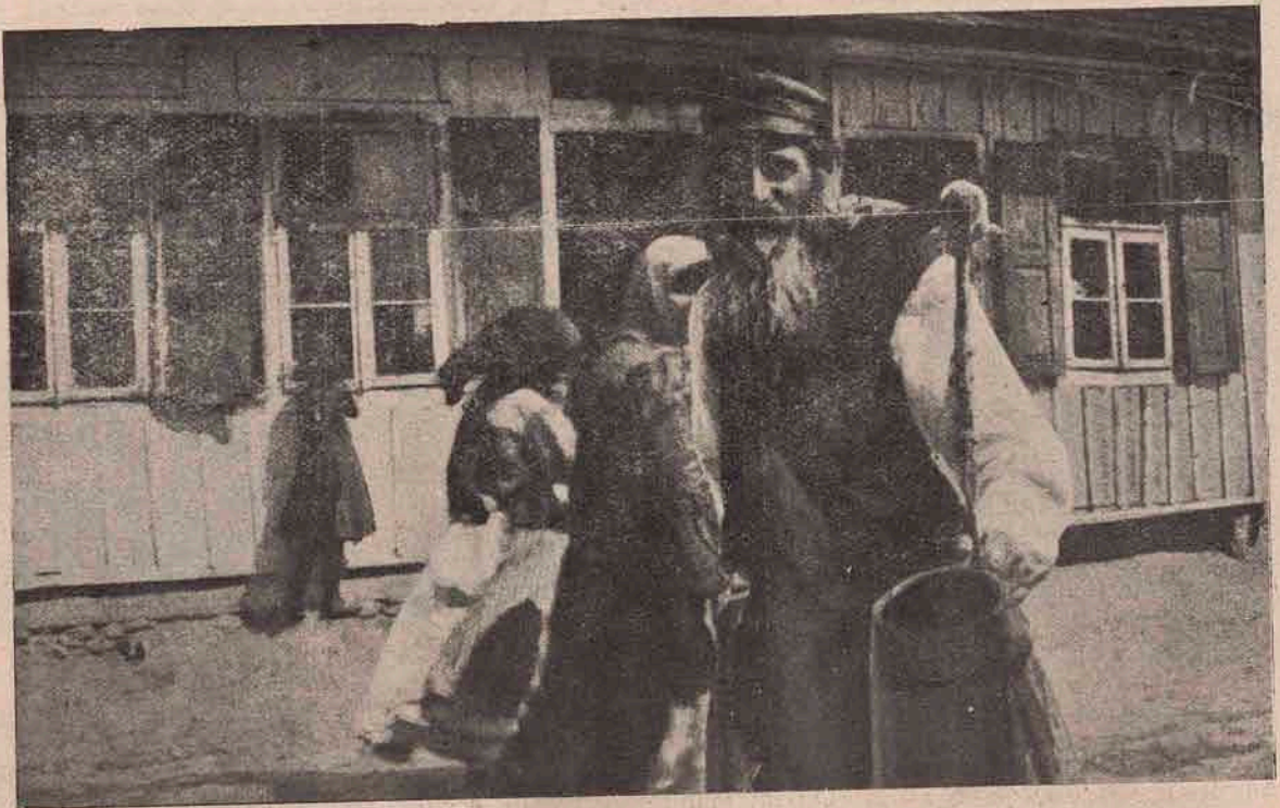
Evreu din Galiția refugiat în Ungaria, din calea Rușilor.

împărțire a Poloniei făcând Varșovia posesiune prusiană. La 28 Noembrie 1806 o ocupară Francezii și în pacea de la Tilsit — dictată de Napoleon I. — Varșovia deveni capitala noului ducat al Varșoviei. În anul 1814 Varșovia căzu iarăși în mâinile Rușilor. Dar Polonezii se răsculară din nou în contra domniei rusești.