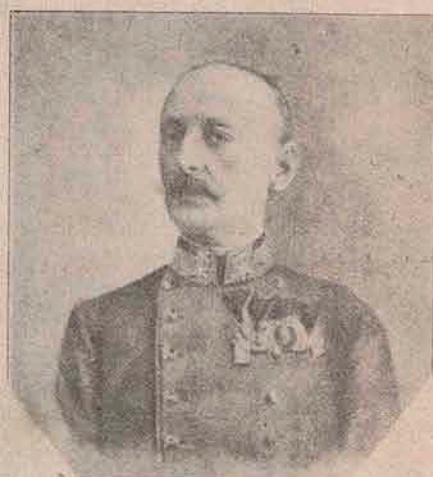
Generalul Ștefan Sarkotits.

dânc înscrise în sângele și inima omului, încât a fost de ajuns îmbrăcarea unei uniforme și ascultarea unui sunet de goarne, pentru ca — omul cavernelor, al peșterilor din vremile străvechi, să se deștepte!