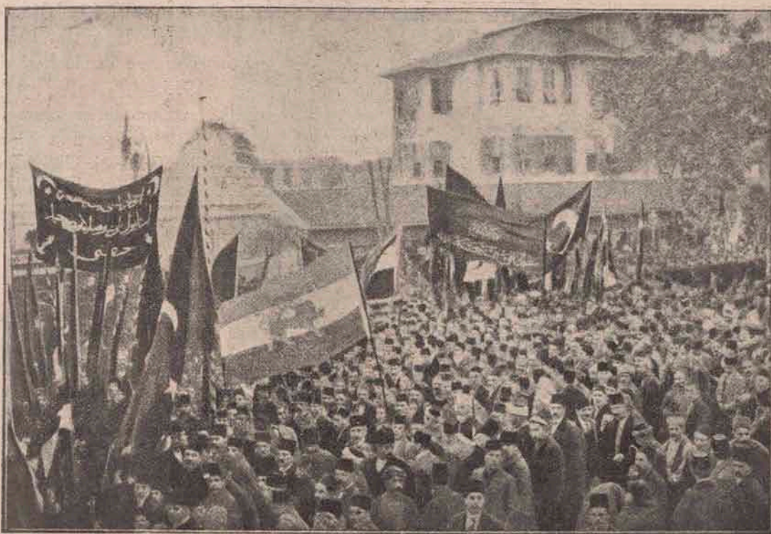
Războiul Sfânt: O manifestație războinică a populației din Constantinopol în fața Seraskieratului (ministerul de război).