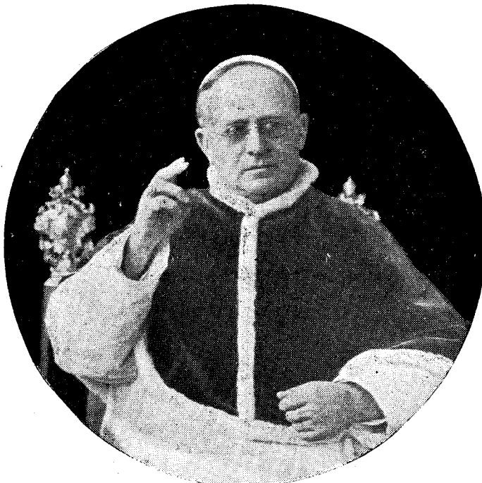
S. Sa PIUS XI.

Fiecare an din viața lui adaugă un mare capitol la istoria Bisericii lui Cristos. Rând pe rând înfăptuiește, cu tineresc elan, mărețele idei pe care la începutul gloriosului său pontificat, le-a sintetizat atât de minunat în cuvântul său programatic : „Pacea lui Cristos în împărăția lui Cristos”. Grijă neînțetată pentru mântuirea sufletelor, arătată mai ales în Anii Sfinți ; intensificarea propovăduirii evanghelice prin Misiuni ; măsurile luate pentru sfințirea și cultura superioară a Clerului, prin reforma învățământului teologic și prin înființarea de noi Seminarii ; Enciclicele despre creșterea tineretului, despre căsătoria creștină și despre soluționarea problemei muncitorești ; acordurile dela Lateran ; Acțiunea Catholică, scumpa Acțiune Catholică, „lumina ochilor Săi”, pe care a definit-o „participarea mirenilor la Apostolatul ierarhic”, sunt o splendidă cunună care împodobește fruntea aceluia care astăzi conduce cu atâta vrednicie destinele Bisericii.