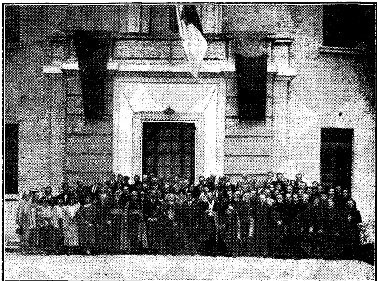
Grupul de pelerini.

Această solemnitate s'a desfășurat în sala cea mare a Expoziției, anume amenajată în acest scop. Pe peretele din față, adică în dosul scenei se vedeau