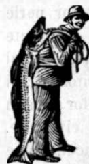
La cumpărarea Emulziei, luați samasă albă mara de scutire alui Scott: Pescarul

este emulziunea lui SCOTT cel mai potrivit mijloc pentru de a preveni alte morburi. Cine folosește pentru prima oară Emulziunea SCOTT, rămâne mirat cât de repede reintregește puterile pierdute. Renumele bun, de care se bucură Emulziunea SCOTT pretutindenea, să bazează deosebit pe ca-