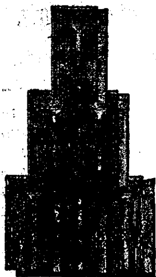
Țigla Bohn de Nagykikinda.