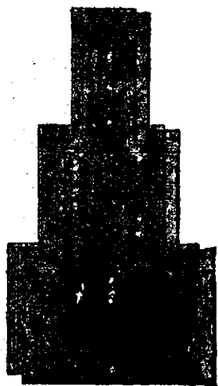
Țigla Bohn de Nagyikiinda.