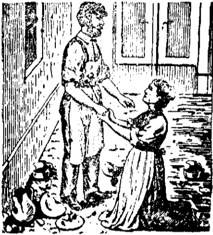
„Maria a căzut în genunchi în fața faurului, i-a sărutat mâinile cu ochii plini de lacrimi, și plângând îngaima o mulțămintă, grăbindu-se spre casă la mica ei fetiță.“

Familia Mariei era foarte săracă. Bărbatul ei se dusese de 4 ani în America și nu i-a mai auzit de veste. Maria se susținea din lucrul mâinilor. Lucra tot lucru greu. Dar pe lângă aceea o mai chinuiau tot felul