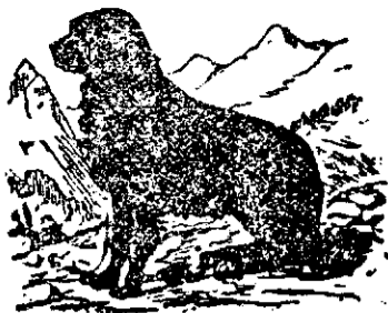
La „Cănele negru“

Recomandă băcănă sa bine asortată cu tot felul de mărfuri și anume: ● droguerie, specerie și coloniale. ●