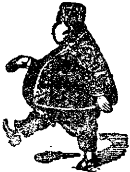
s'a îngrășat de 130 Klg.