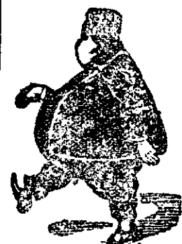
s'a îngrășat de 120 Klgr.

Pentru anemici, femei în galbi- nare, pe cari li doare foarte mult mijlocul spatelor, căror le slăbese pu- terile la un lucru bagatel, pe cari con- secvent li doare ca-