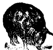
După folo ință.