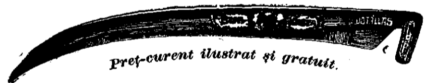
Preț-curent ilustrat și gratuit.

Coasa de oțel „Bur“ numai atunci este veritabilă, dacă pe mâner poartă gravată inscripția aceasta: W. G. Kőbánya , iar pe stul ei este tipărită marca firmei cum arată figura asta: 190 6—20