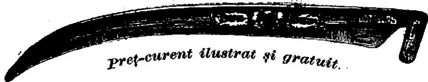
Preț-curent ilustrat și gratuit.

Coasa de oțel „Bur“ numai atunci este veritabilă, dacă pe mâner poartă gravată inscripția aceasta: W. G. Kőbánya , iar pe latul ei este tipărită marca firmei cum arată figura asta: 190 6—20