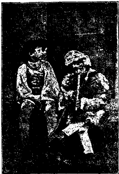
Ciobănași din Ardeal.

După-ce și-a adunat o avere însemnată, se întoarce în patrie, plin de ură în contra Burilor, pe cari în realitate nici nu i-a cunoscut. Burul, din partea sa, are o ură de rasă în contra Englezilor; dar până la năvala lui Jameson ura aceasta a fost numai de rasă și nici de cum personală. Eu cunosc foarte bine pe Olandezii din Cap și pe Bur. Am trăit multă vreme în intimitate cu ei și am venit în atingere cu ei în felul de fel de ocazii. Am aflat totdeauna că ei au suflet nobil, sunt buni de inimă și ospitalieri. Nu sunt de loc sfâșiți, dar nici așa de negri cum sunt descriși. Burul cultivă cu zel virtuțile casnice. Iși iubește căminul și se consideră cu atât mai fericit, cu cât familia lui e mai numeroasă. Fără îndoială că și printre ei există haimanale, oameni de nimic, ca și printre Englezi; dar a spune despre Bur că e crud, imoral, mișel, — e o mare greșeală. Burul e înimos, se gândește mult și e greu de convins. Posede o mare stăruință și energie și dacă s'hotărăște odată la ceva, e greu a-l abate dela acea hotărâre. Toate aceste calități fac din el un adversar cu atât mai primejliș.