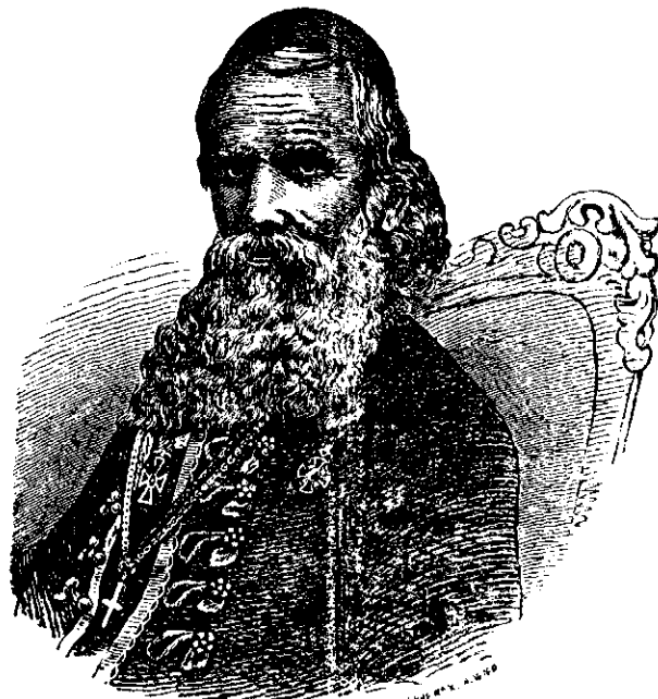
ALEXANDRU STERCA ȘULUȚIU.

În timp ce această idee conducătoare era farul dorului și aspirațiunilor lor, n'au habar n'aveau însă de faptul, că însăși creștinismul religioasă cum cade jertfă unor neghioabe greșeli și intervertiri, și n'au