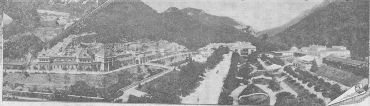
Hotel Franz Josef. Valea Cernei.