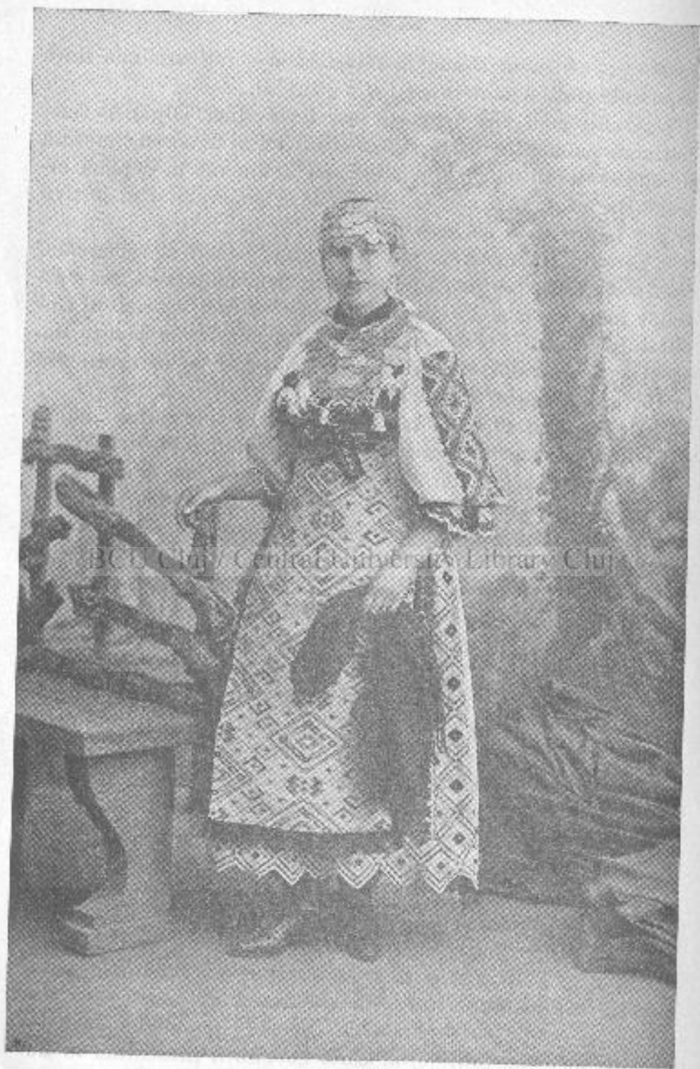
Costum premiat cu premiul I. cu ocaziunea adunării generale a Asociațiunii din 1900.