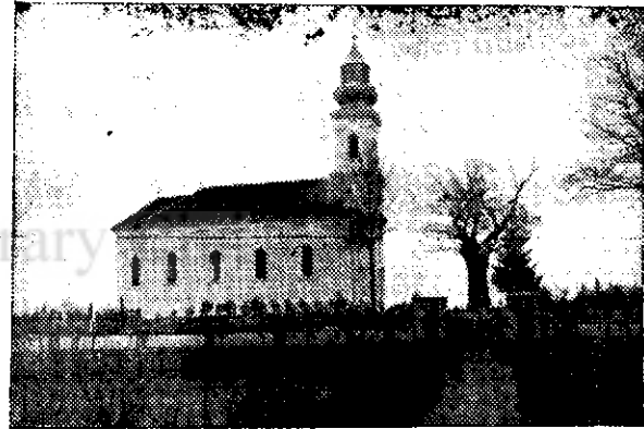
Biserica din Tebea, mormântul lui Avram Iancu și Gorunul lui Horia