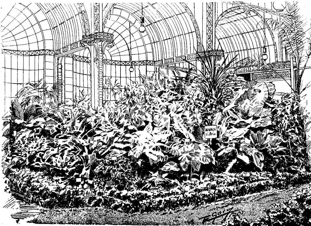
Esposiția de plante anuală și vivace la Paris.