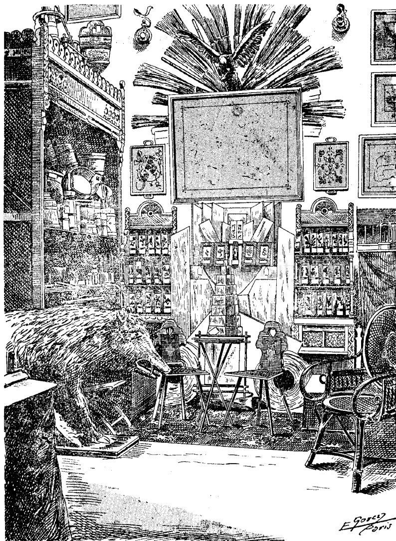
Expoziția produselor forestiere de pe domeniul oronei din România.