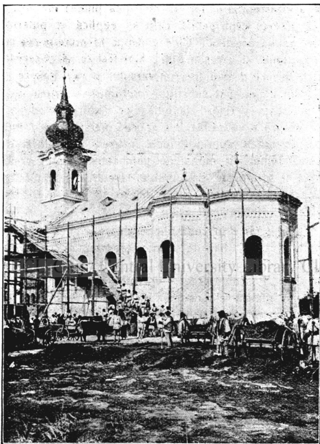
Biserica din Uifalău-Tâmpăhaza.

Dela sine? Și dacă nu și-au primit existența dela sine, dela cine o-au primit?