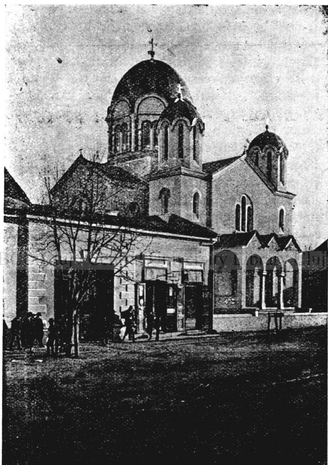
Noua Biserică românească din Gherla.

Originalul grecesc se conservă în București, la Academia română, ia nr. 605.