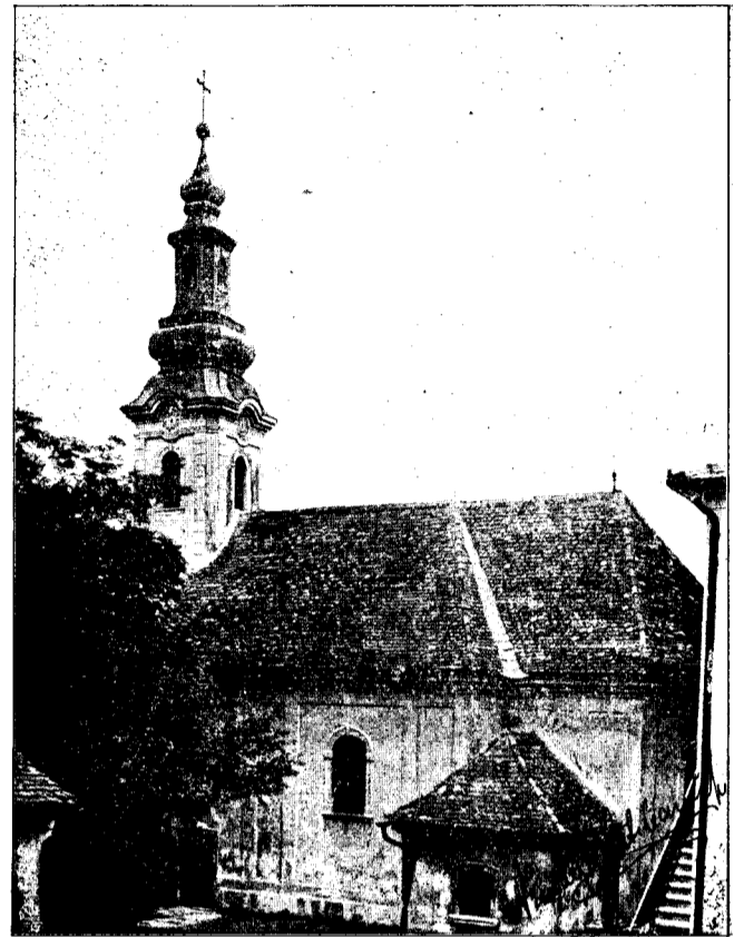
Biserica lui Bob în Cluj.

1. Titlul I. al Decretelor este închinat întreg comemorării sărbătorești a evenimentului aceluia mare, întâmplat înainte cu două sute de ani, când părinții noștri la 5 Septemvrie 1700 au încheiat sfânta Unire religioasă cu Biserica Apostolică a Romei celei vechi. Juvenitu-s'a și sfânt și evlavios a fost gândul Părinților Sinodali, ca inaugurarea lucrărilor Sinodale s'o înceapă cu sărbătorirea, pomenirea și eternizarea aceluia fericit eveniment, care a fost începutul unei Legi noave, a noului Testament pentru poporul românesc, deopotrivă în privință religioasă cât și culturală. Manifestul sfintei Uniri, pecetluit în Bălgradul Ardealului, pentru poporul românesc a fost Tablele Legii aduse de Moise poporului evreesc de pe muntele Sinai. Unirea bisericească încheiată cu mama Biserica romană marchează în istoria neamului nostru tocmai așa o graniță, ca și Crucea de pe Golgota. Unirea a fost în-