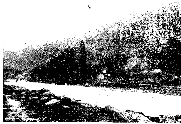
Someșul la Sângeorzul românesc.