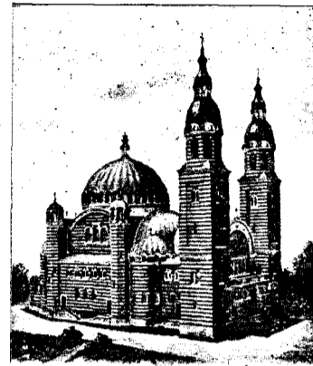
Catedrala din Sibiu.

1. E de înșămnat, că pentru realizarea unității naționale, ori și ce am înțeleg sub dânsa, prima și neincunjurata condițiune ar fi unitatea pe terenul doctrinelor, căci din aceste provin simțemintele, moravurile și aspirațiunile. E mai departe neapărat de lipsă, ca aceste doctrine să