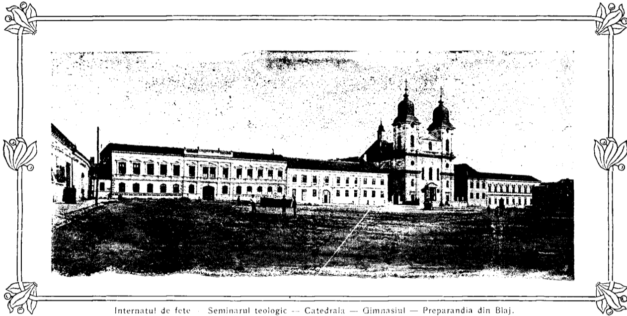
Internatul de fete — Seminarul teologic — Catedrala — Gimnaziul — Preparandia din Blaj.