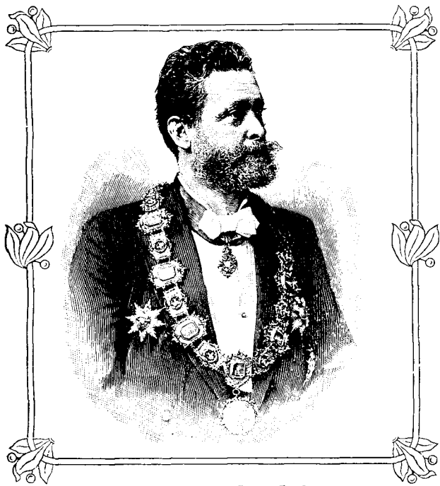
Primarul Vienei Dr. C. Lueger.

Ca foaie care este călezită de principiile creștinismului pozitiv, ne facem plăcerea a ne împodobi acest număr cu chipul aceluia bărbat, care în împărătescul oraș al Vienei a ridicat și a dus la isbândă steagul vieții creștinești, luptând împotriva acelor ovrei și argați ai lor, cari au inveninat cu rățecitele lor idei viața sufletească a popoarelor, ear cu apucăturile lor au exploatat și exploatează neamul creștinesc în tot chipul.